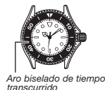
Aro biselado de tiempo transcurrido